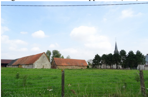
Une ferme du village