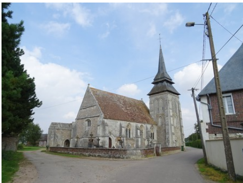
L'église du Plessis Saint-Opportune (MH)

Les avis seront cohérents avec ceux émis ces derniers années, à savoir : pas de maisons à volume compliqué (type V, W, Y, ou Z), pentes à 45° pour les volumes principaux, ardoise ou tuile plate de teinte brun vieilli, à 20u/m², avec un débord de toiture de 20cm, enduit de teinte beige clair avec modénatures (au choix : chaînages, encadrement de fenêtres, soubassement, colombage...). *Voir les autres fiches.