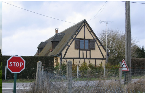
Une maison aux abords