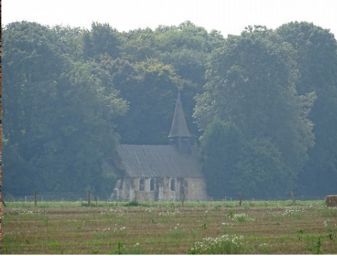
La chapelle Saint-Léger (vue lointaine)