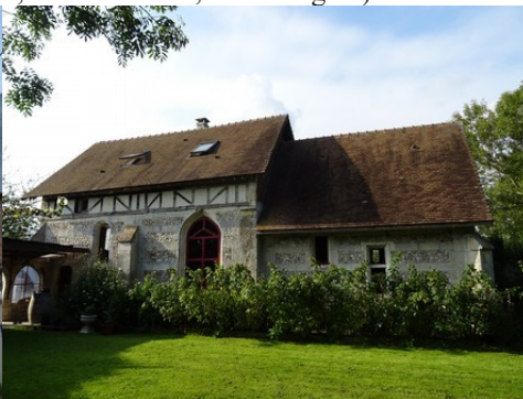
L'église de la Huanière