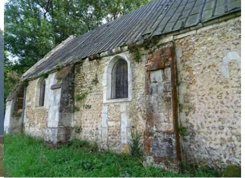
La chapelle Saint-Léger (détail)

Pour la zone en rose foncé dans le périmètre de 500m