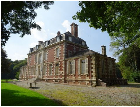
La façade sud du château