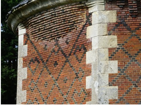
Le colombier (détail)