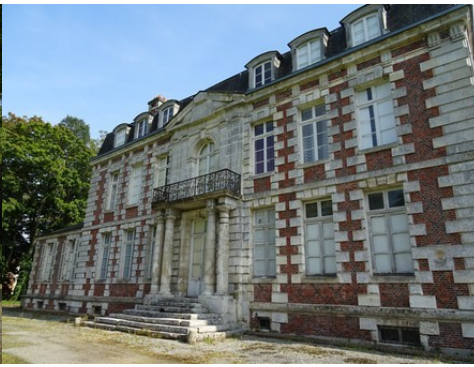
La façade nord du château